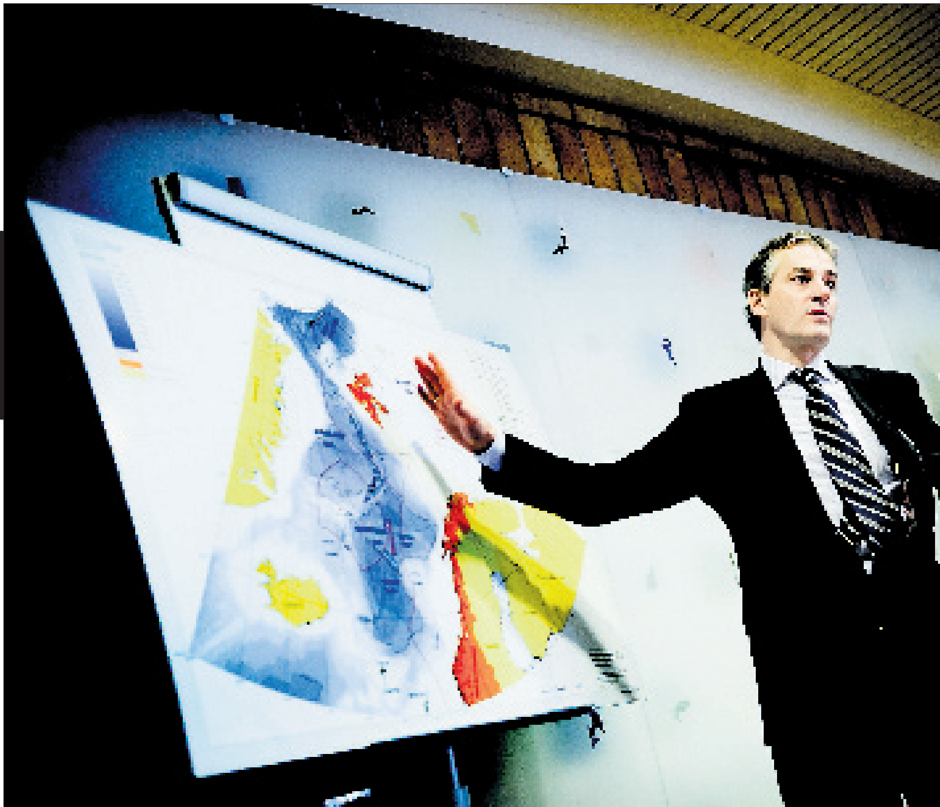
Utenriksminister Jonas Gahr Støre. Størrelsen på Norges kontinentalsokkel i nord avklares.