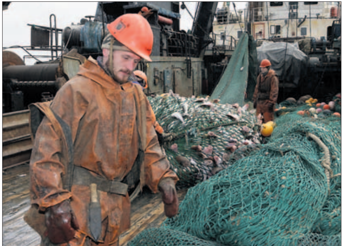
SUKSESS: Fiskerisamarbeidet mellom Norge og Russland foregår i en rolig atmosfære utenfor medienes søkelys, skriver Geir Hønneland. Bildet er fra den russiske fabrikktråleren «Leonid Gulschenko».

Årets kommisjonsmøte fant nylig sted i svartehavsbyen Sotsji. Kontrasten til sesjonen i 1999 kunne knapt vært større – ikke bare klima-