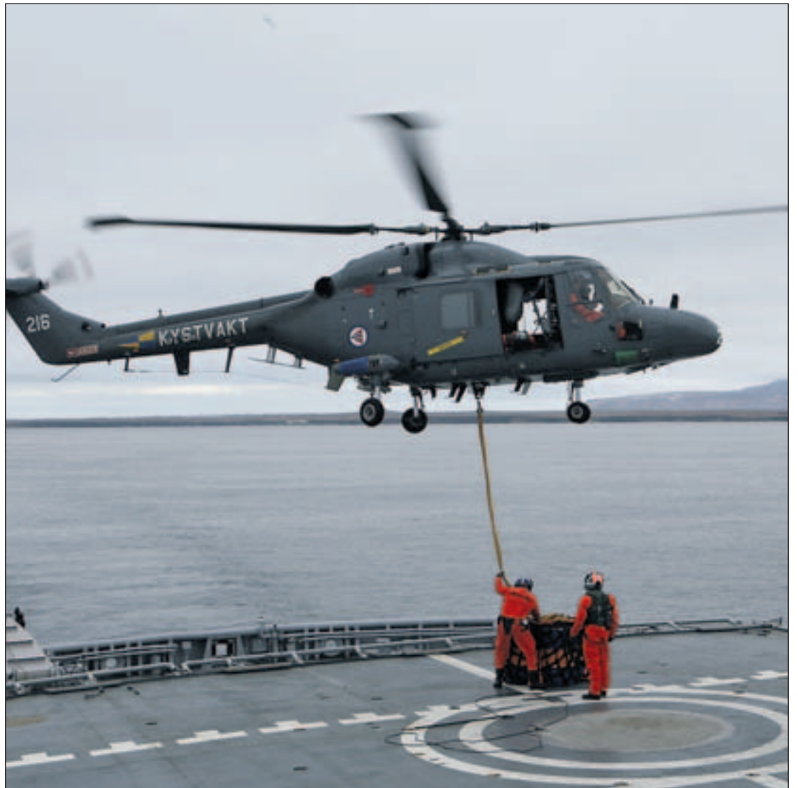
NATO SIN ROLLE I NORD: Norge ønsker at Arktis og nordområdene skal få en naturlig plass i NATOs arbeid med etableringen av alliansens nye strategiske konsept.

Rent operativt er så å si all NATO-oppmerksomhet rettet sørover – altså mot Afghanistan. Den over-