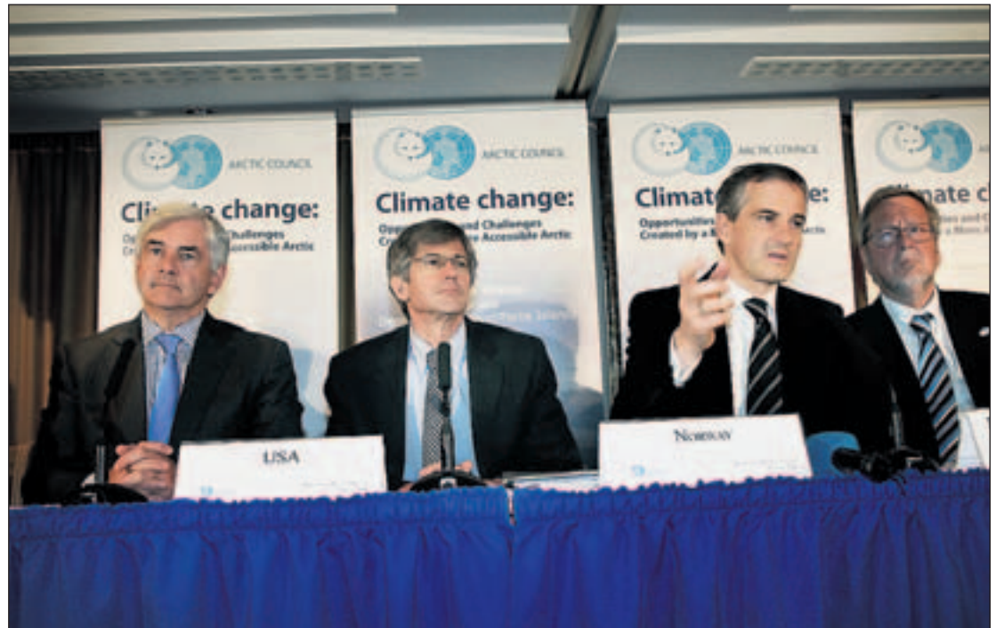
ARKTISK RÅD: Utenriksministermøtene er høyeste møtenivå innen Arktisk Råd. Det holdes annenhvert år. Her fra det siste møtet som ble holdt i Tromsø i fjor.

For få uker siden møttes de fem igjen, denne gangen på enda høyere nivå med Hillary Clinton og Sergej Lavrov rundt det samme bordet som Jonas