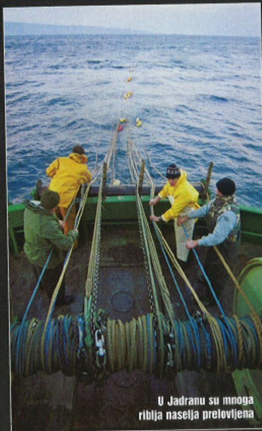
U Jadranu su mnoga riblja naselja prelovljena

- Kako primjenu gospodarskog pojasa postići na Jadranskom moru?