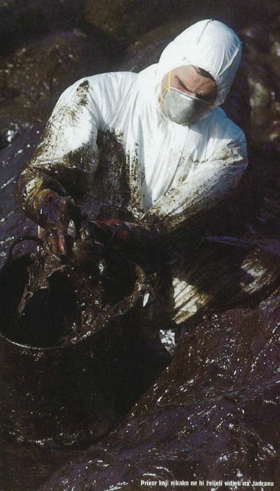
Prizor koji nikako ne bi željeli vidjeti na Jadranu