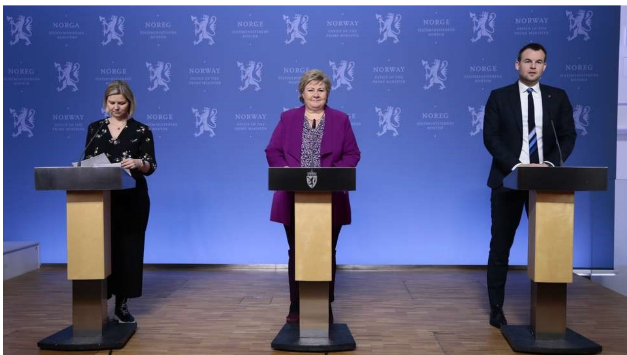
Flere fremtredende jurister reagerer på regjeringens kriselov.

Torsdag behandles lovforslaget fra regjeringen i Stortinget. Flere kjente jurister reagerer på loven. Blant dem er Morten Walløe Tvedt fra Molde.