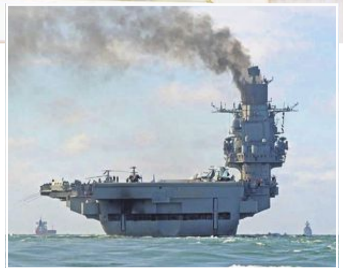
FLÅTE: Den russiske flåten til Middelhavet ble anført av hangarskipet «Admiral Kuznetsov».